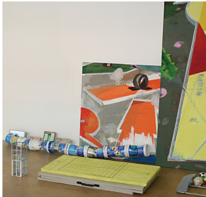
oben Installationsansicht MINIGOLFBAHN, 08 mixed media, unterschiedliche Maße