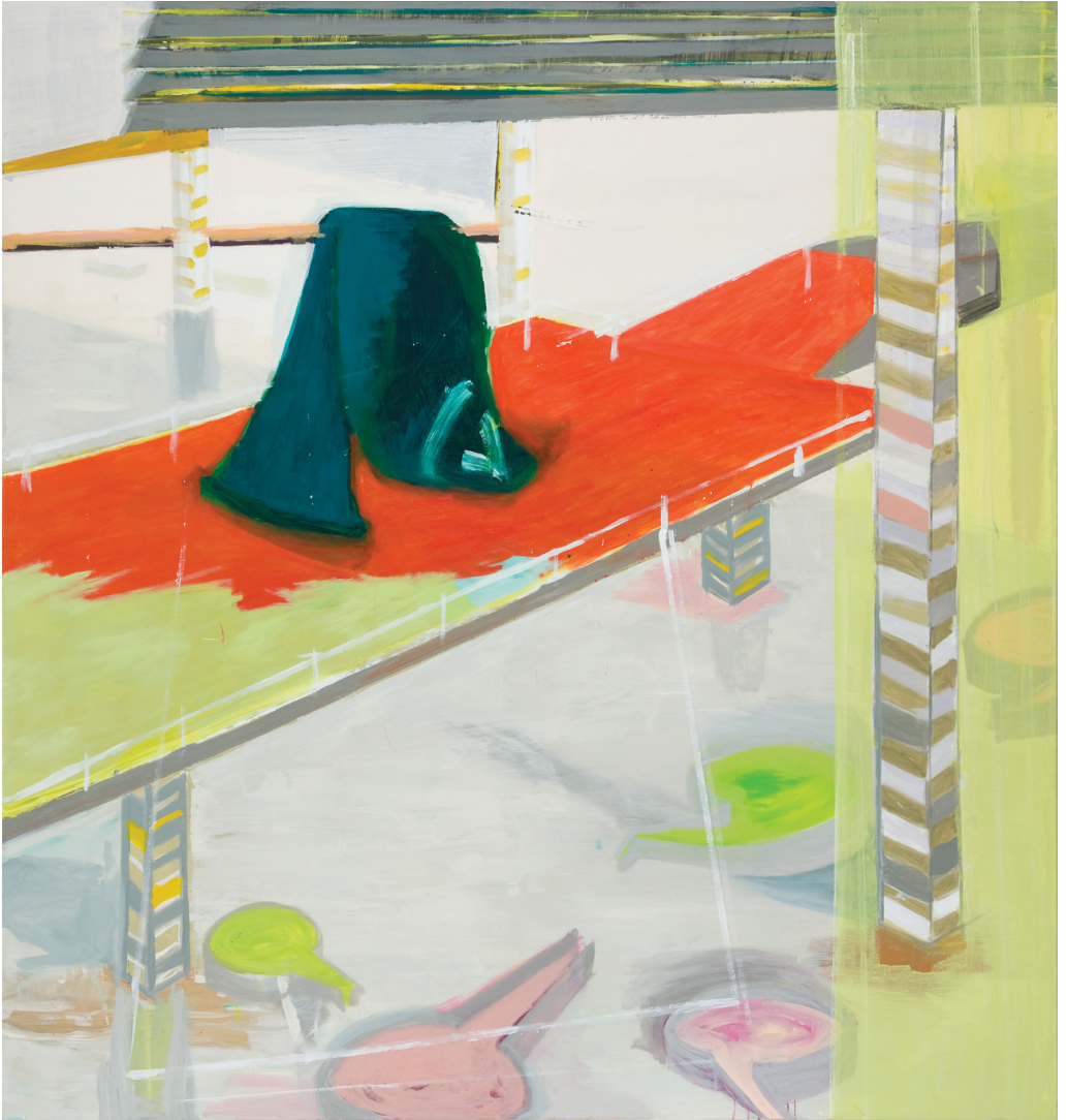
Bahn1, 07 Acryl, Öl/LW 170 x 160 cm