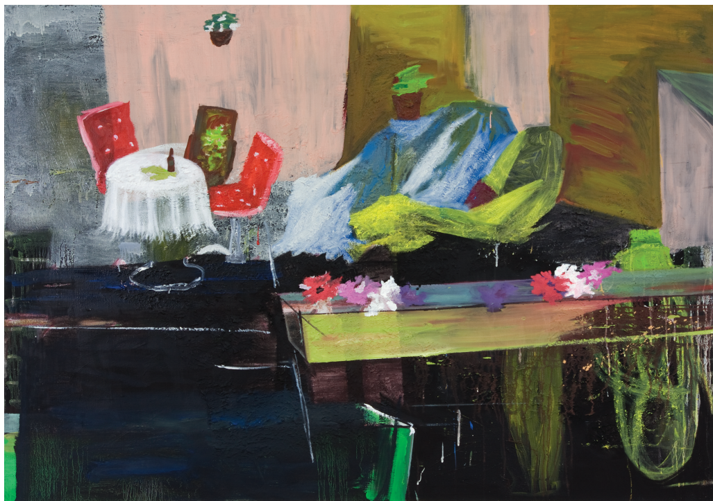
Golfpause, 08 Acryl, Öl/LW 130 x 170 cm