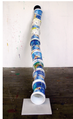
rechts Bahn8, 08 Acryl, Öl/LW 190 x 120 cm