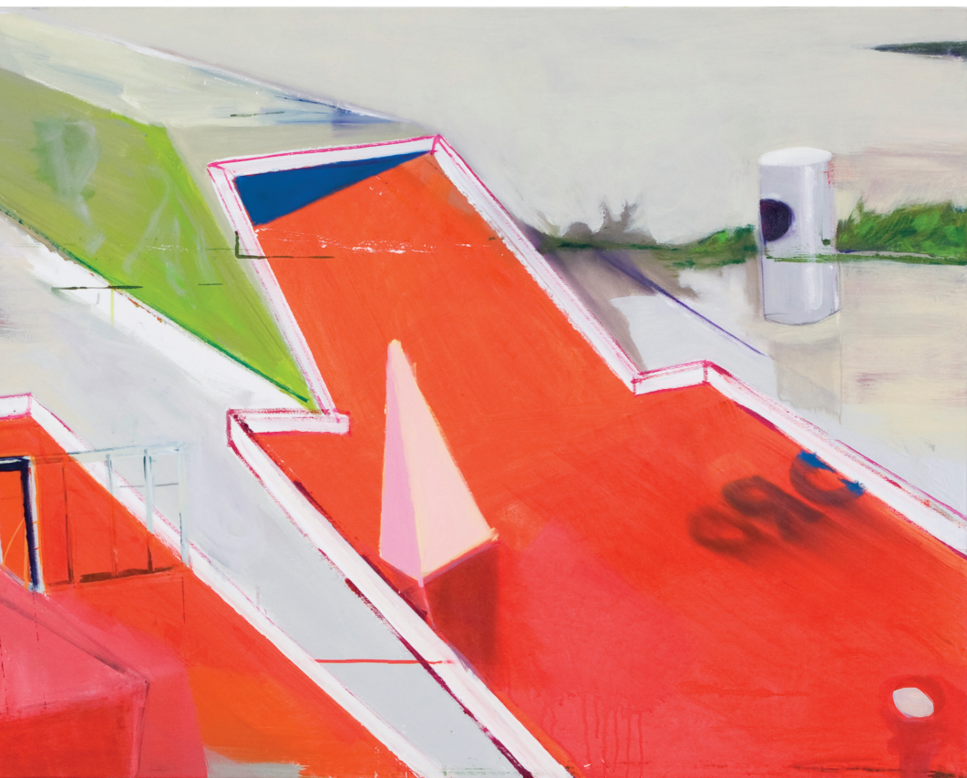
Bahn4, 07 Acryl, Öl/LW 80 x 200 cm