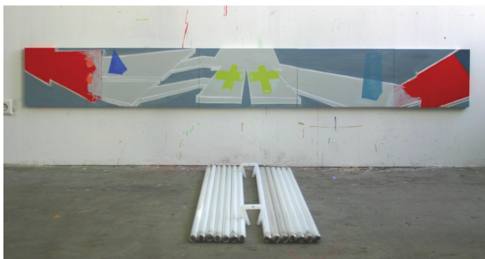
Bahn19, 08 Malerei auf Holz, Leuchtstoffröhren, Kunststoff, Styropor, Außenmaße ca. 250 x 250 cm