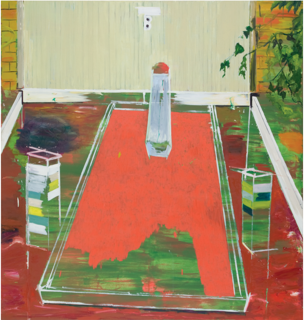
Garagentor, 07 Acryl, Öl/LW 170 x 160 cm