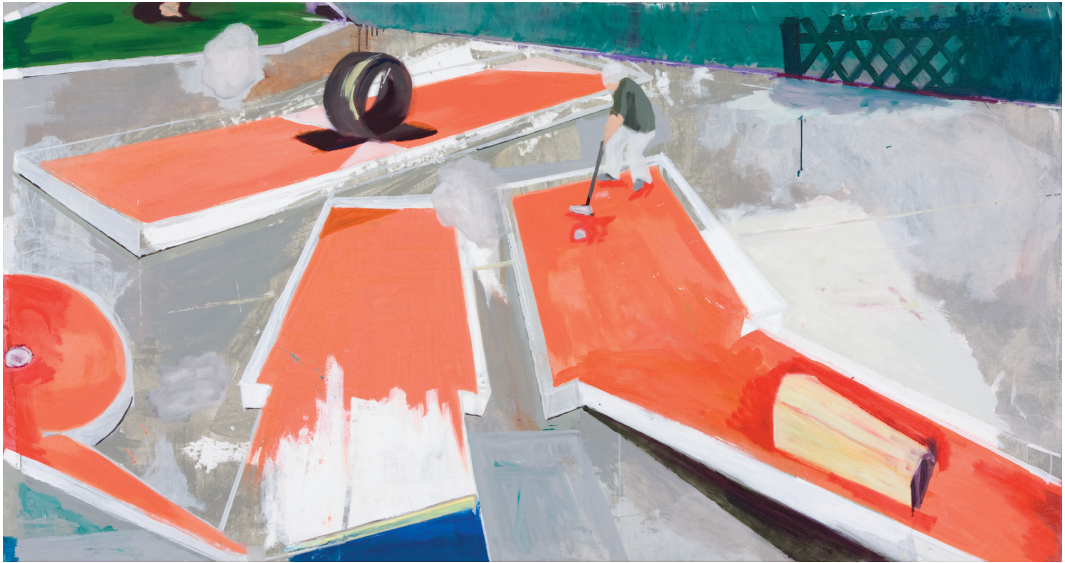
Bahn2, 07 Acryl, Öl/LW 100 x 170 cm